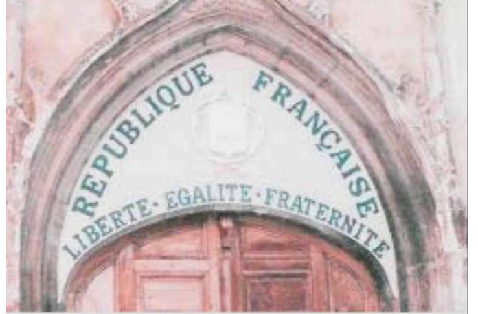
Jakoben laikliğin neye benzediğini en iyi gösteren resimlerden biri budur: Fransa'da bir kilise; kapısında Fransız Cumhuriyeti ve eşitlik kardeşlik özgürlük yazılı

La classe cléricale est la complice des crimes liberticides commis par la Monarchie ;