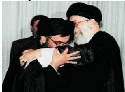
Nasrallah ve Hameney

A la 10ème anniversaire de la création du Hezbollah, Nasrallah devenait son secrétaire général.