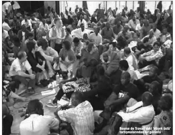
Bourse de Travail'daki 'düşek üstü' tartışmalarından bir görüntü

Fransa AB ülkeleri içinde kağıtsızlara toplu kağıt dağıtmayan tek ülke durumundadır. Bu yolla Avrupa'da kağıtsız işçilerin en çok toplandığı ülke durumuna gelmiştir. Aynı nedenle de kağıtsız işçiler her gün teker teker en çok oturum izni verilen ülke de Fransa'dır. Kağıtsızlara kitlesel olarak oturum izni dağıttıktan sonra kapıları sıkı sıkıya kapatan diğer AB ülkeleri bu durumdaki rahatsızdırlar ve Fransa hükümeti üzerinde giderek artan bir baskı uygulamaktadır. Fransa hükümeti bu nedenle bu soruna bir çözüm getirmeyi gündemine zaten almak zorunda ve almış durumdadır. İşte 10 Ekim'deki görüşmenin ardından bu etkeni gözden kaçırmamak gerekir. Bu saptama aynı zamanda sürecin özündeki tuzaklara işaret eder. Hükümet zaten bu soruna çözüm bulmak zorundayken gündeme gelen ve güçlenen kağıtsızlar hareketi bu uygun momentte güçlü bir muhatap haline geldiği için kabul görmüştür. Bir bakıma bilerek bilmeyerek bu fırsatı en iyi değerlendiren odak Kağıtsızlar bakanlığı olmuştur. Ama elbette bu fırsatın yararlanmak isteyen tek odak değildir.