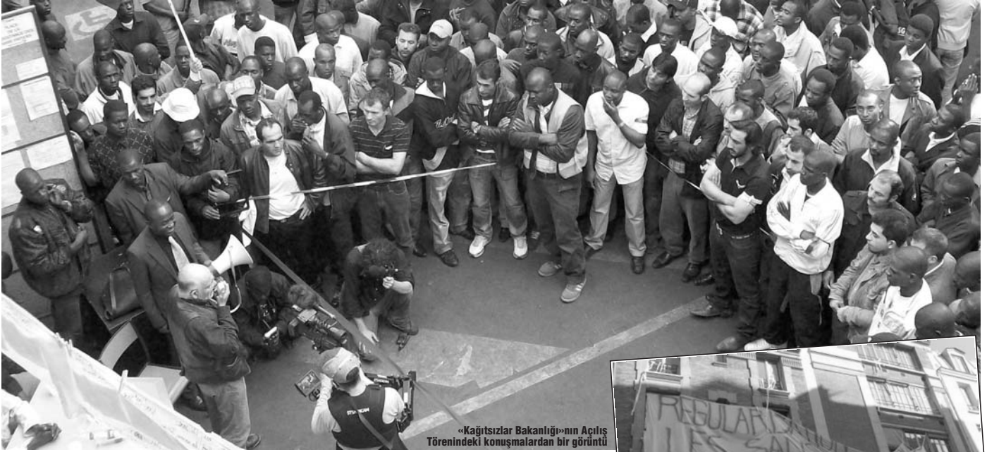
«Kağıtsızlar Bakanlığı»nın Açılış Törenindeki konuşmalardan bir görüntü