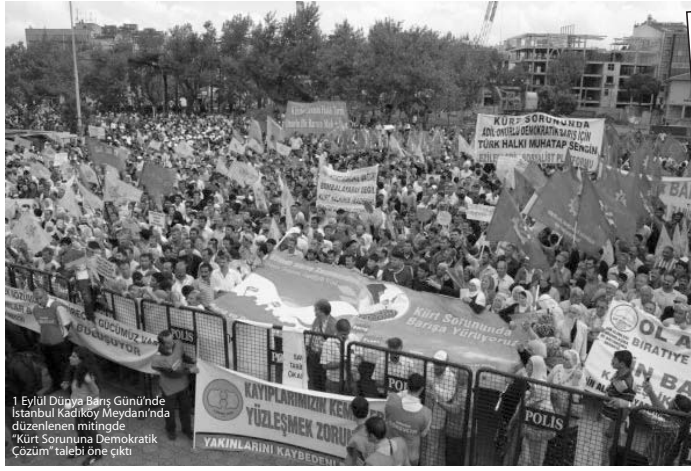
1 Eylül Dünya Barış Günü'nde İstanbul Kadıköy Meydanı'nda düzenlenen mitingde, "Kürt Sorununa Demokratik Çözüm" talebi öne çıktı