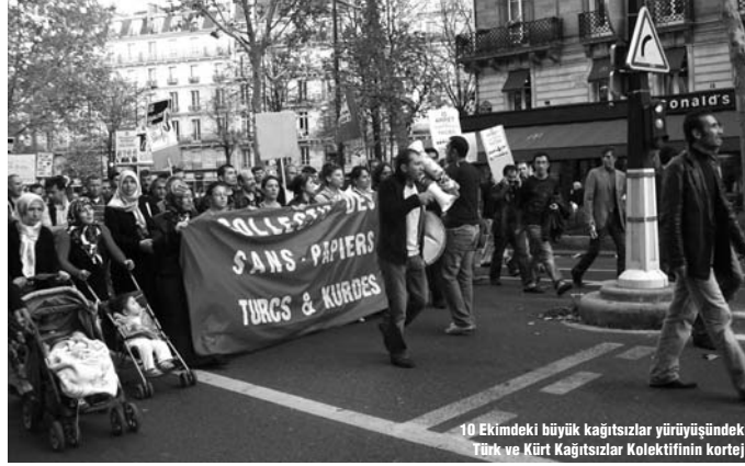
10 Ekimdeki büyük kağıtsızlar yürüyüşündeki Türk ve Kürt Kağıtsızlar Kolektifinin korteji

Doğrusu bu gelişmenin ardından bazı konjonktürel etkenleri de unutmamak gerekir. Zira Türkiyeliler öteden beri daha çok siyasi ilacı yolunu seçmekteyken yakın dönemde bu kapı AB sürecine de paralel olarak kapanmaktadır. Beri yandan Sarkozy döneminde çıkan