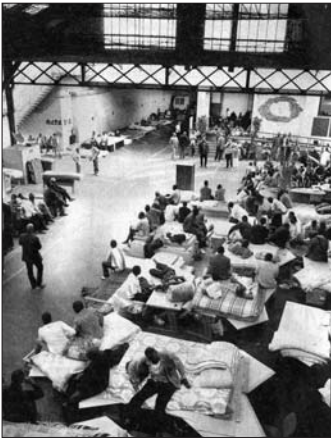
14 Rue Beaudelique adresindeki işgalin içeriden görüntüsü

Kuşkusuz daha önce görülmeyen bu desteğin