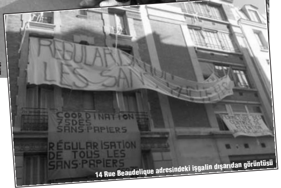
14 Rue Beaudelaïque adresindeki işgalin dışarıdan görüntüsü

Bunun üzerine işgale kağıtsızlar bir kez daha valiliğe topluca dosyalarını sunarak işin yürütüşü geçtiler ve reddedildiler. Bunun ardından her çarşama işgal ettikleri binadan çıkarak yürüyüş yapmayı adet edineceklerdi. Zaman zaman da Paris'te gerçekleşen muhtelif eylemlerde varlıklarını göstermeyi sürdüreceklerdi. Bu süreçte İşgal Altındaki Bourse Günlüğü diye bir bülten yayınlanmaya başladı; bir web sitesi kuruldu ve zaman zaman internet üzerinden video klipleri yayılmaya başladı. Bu bakımdan işgal yine örgütlenmiş ve kurumlaşmıştı. Bununla birlikte aynı zamanda da tecrit koşullarına hapsolmüştü.