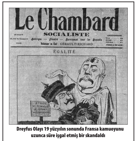
Dreyfus Olayı 19 yüzyılın sonunda Fransa kamuoyunu uzunca süre işgal etmiş bir skandaldı

Köz'ün arkasında duran dönüşmesini sağlayacak bir devrimci partinin yerini tutmadıklarının bilincindedirler. Ama bu tür vesileleri Bolşeviklerin mirasına sahip çıkacak devrimci partiyi yaratma azmiyle mücadele eden militanların bilinçlerinin açılması, kararlılıklarının pekişmesi ve kendini bu mücadelede adayan militanların artması için kullanmayı da ödevleri arasında görmektedir.